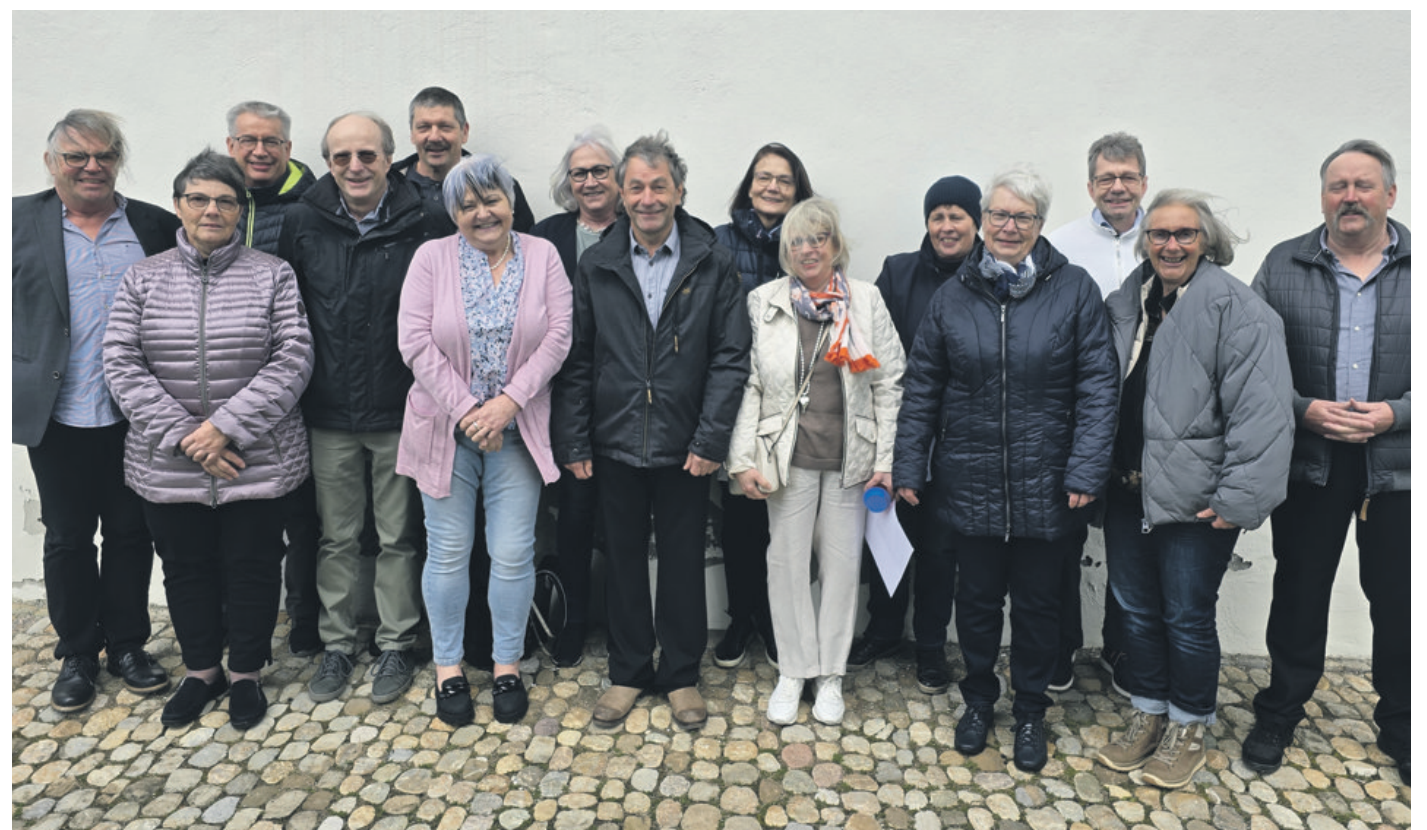
Goldene Konfirmandinnen und Konfirmanden 2024