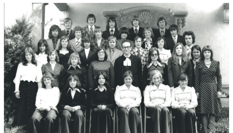
Die Konfirmandinnen und Konfirmanden von 1974