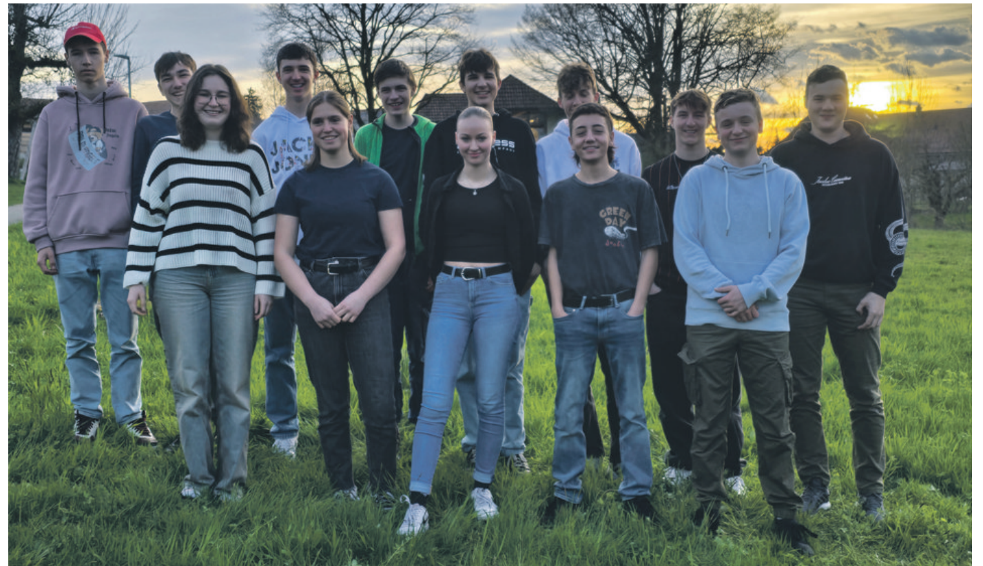
Konfirmandinnen und Konfirmanden 2024